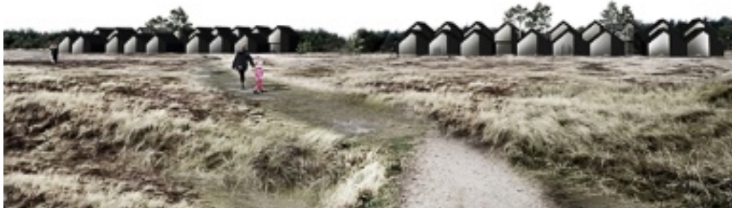
Figur 1 Visualisering af hotellet

Hotelbebyggelsen er landskabeligt tilpasset ved at opdele bebyggelsen i tre enklaver af ca. 15 boenheder. Enklaverne får derved et langt mindre massivt udtryk samt en gennemsigtighed, hvor området bag bebyggelsen med, eksisterende træer og beplantning forsat er tydeligt. De store åbninger mellem enklaverne er fuldt offentlige og skal fungere som adgang til og fra stranden, ligesom det fungerer i dag. Ligeledes friholdes et stort areal umiddelbart syd for hotelbebyggelsen til rekreative aktiviteter, sådan at områdets nuværende funktion opretholdes.